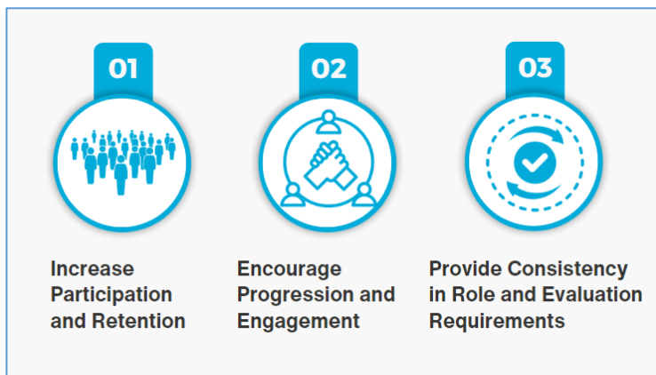
Objectifs du projet de parcours

Le projet de parcours des officiels est axé sur la transformation du développement et de la gestion des officiels à travers Natation Canada. Après 50 ans de service, le système actuel de certification basé sur les niveaux est désormais en décalage avec l'évolution des besoins personnels et professionnels des bénévoles. Ce projet introduit un parcours dynamique, spécifique à un rôle, qui met l'accent sur la flexibilité, l'inclusion et l'adaptabilité pour l'avenir du rôle de l'officiel.